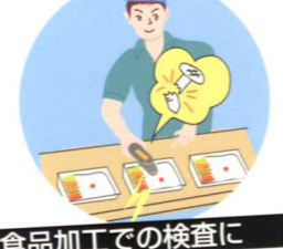
食品加工での検査に