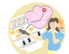
店内商品の安全管理に

すべての金属に反応し、 ランプ・ブザー・バイブレーションの (MDS-100V) 3段切替で知らせる 超高感度な金属探知器、新発売!