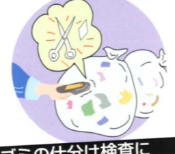
ゴミの仕分け検査に