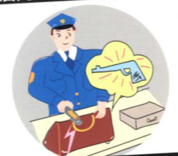
保安用や手荷物検査に