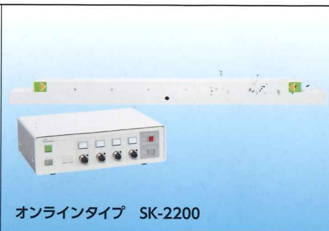
オンラインタイプ SK-2200